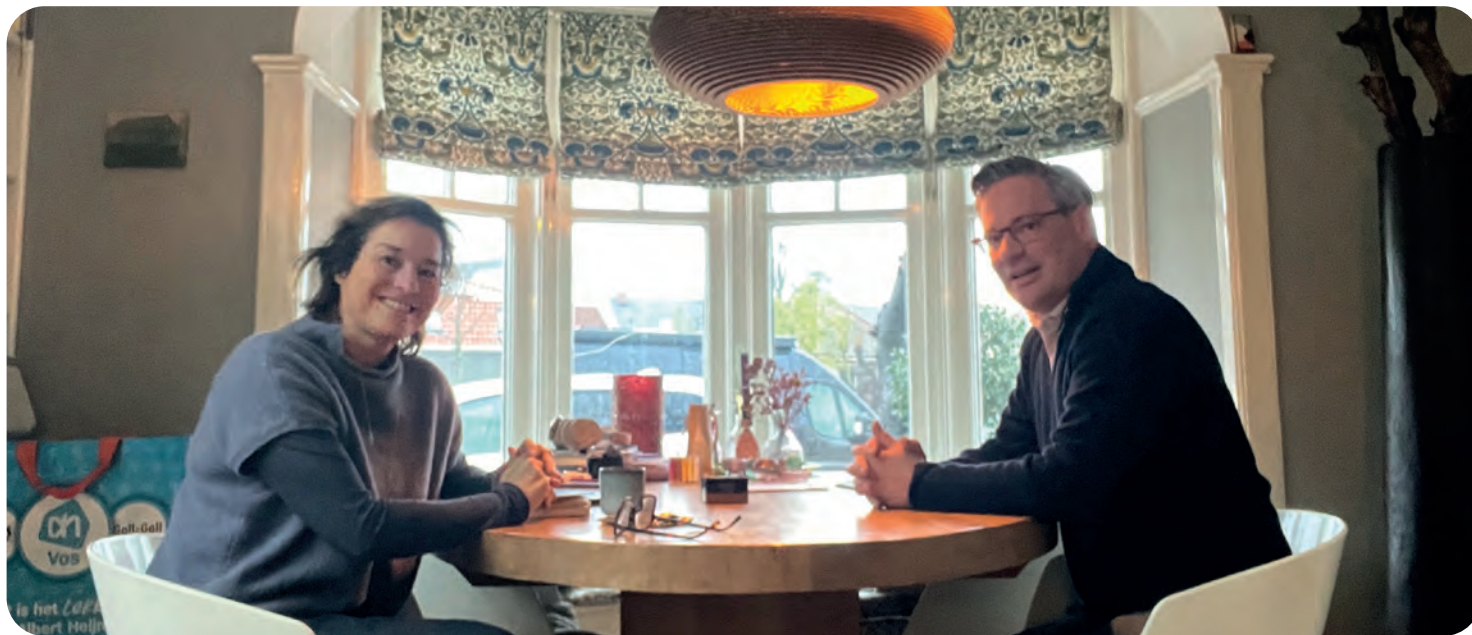
Gesprek aan de keukentafel