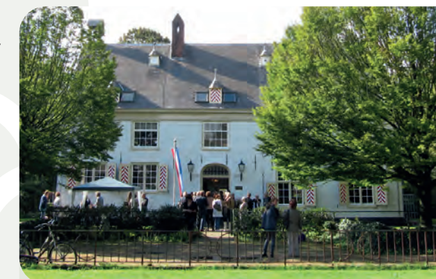
Huis te Zaanen

Nieuwsgierig geworden? Kom vooral een keer luisteren en ontdek de charme van de MOT!