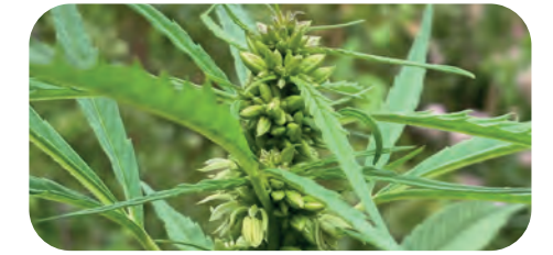
Cannabis in de Heemtuin

witte bloemetjes. In augustus zaten er kleine zaaddoosjes in en in oktober was de plant verdwenen met wortel en tak. Wat denk je? Zijn we dealers geworden?