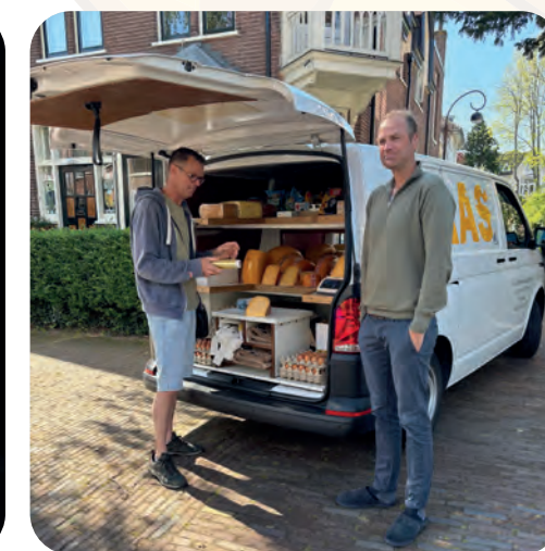
Tweede generatie kaasboer met een tweede generatie klant