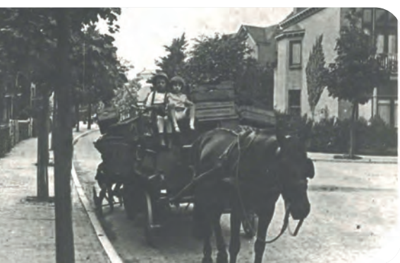
Groenteman met paard en wagen in de Vredenhofstraat ca 1925