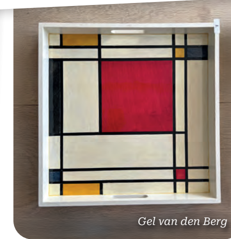
Gel van den Berg