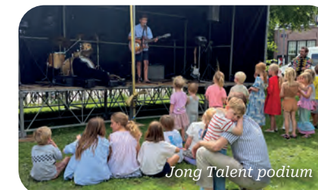
Jong Talent podium