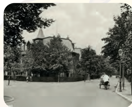
Eenzame melkboer met handkar in de Eindhovenstraat ca 1925