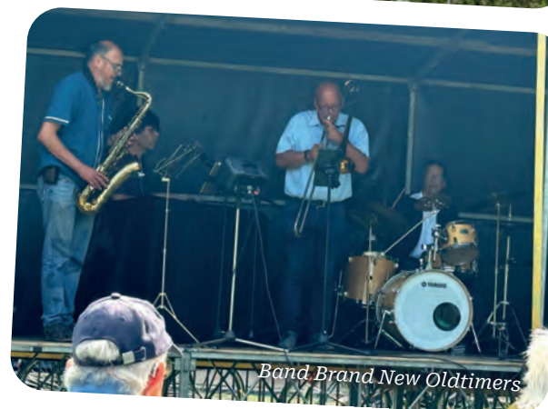
Band Brand New Oldtimers