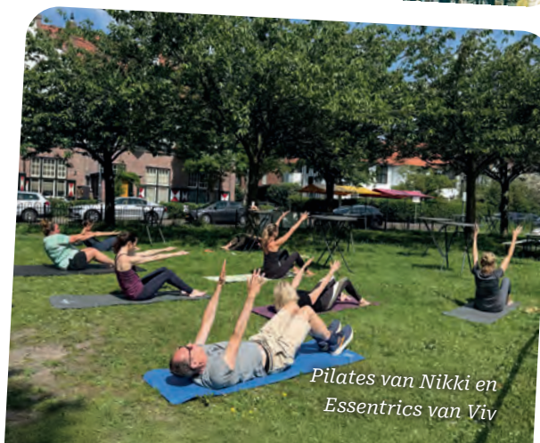
Pilates van Nikki en Essentrics van Viv