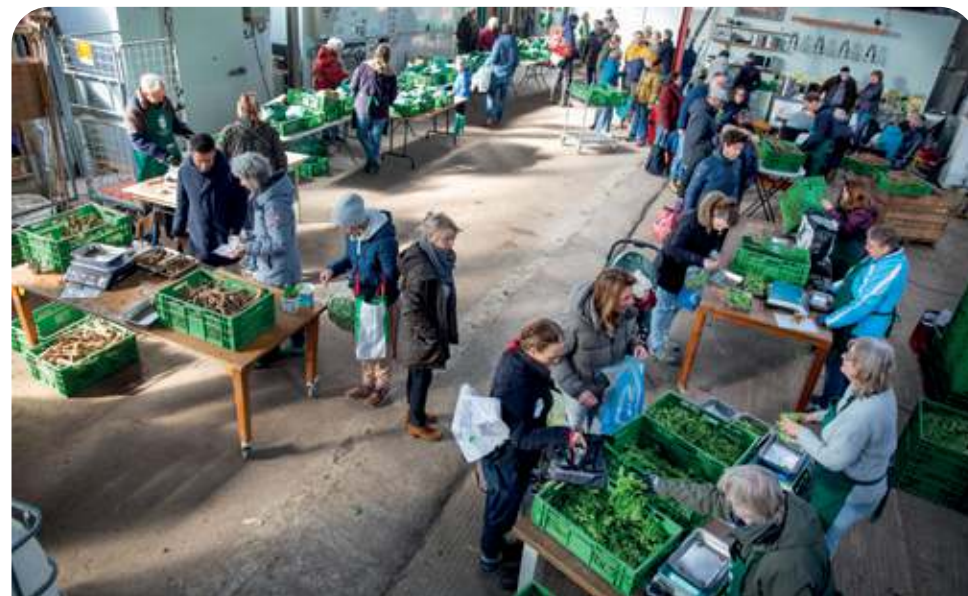
Gezellige drukte bij de uitgifte op zaterdagochtend