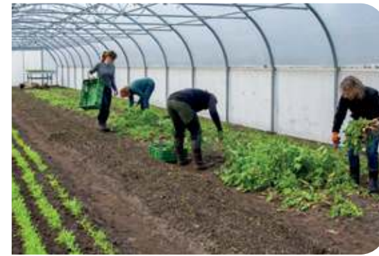
Oogsten in de kas