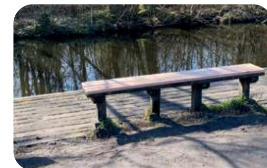
Het bankje is hersteld na schade