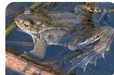
Kikkers zijn er weer!

Tjonge, wat is het pad van de heemtuin deze winter modderig geworden. Als je er wilde lopen was het glibberen en glijden.