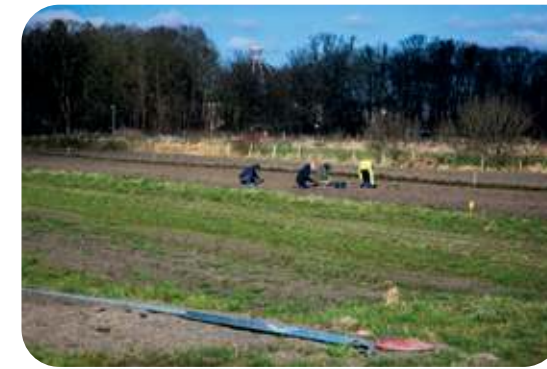
Werken op het land