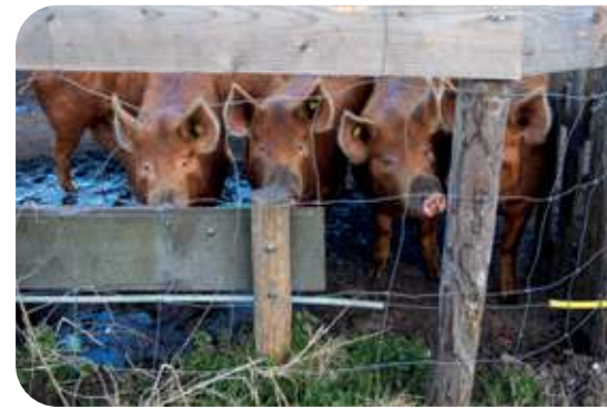
De op Dierendag geboren biggen

In de grote schuur hing een ontspannen sfeer en stonden de kraampjes nog waar de leden hun groentes hadden opgehaald die ochtend. Wij sloten aan bij de rondleiding over het terrein. Leden vertelden vol enthousiasme over hun boerderij. Er waren varkens en schapen, akkers vol gewassen, bijenkasten, een boomgaard en een prachtige kruidentuin. Om lid te worden moest je nog een informatiebijeenkomst bijwonen. Hier hoorden we alles over het reilen en zeilen van de boerderij. Hierna kon je er nog voor kiezen om eerst proeflid te worden, maar wij waren al overtuigd. Wij werden lid!