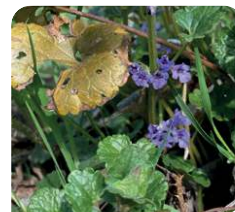
Hondsdrif bloeit al

Door een calamiteit zullen we eind maart opnieuw moeten inzaaien met het nieuw aangeschafte zaad. En dan hopen we maar dat het ons dit keer lukt om de plantjes groot en in bloei te krijgen.